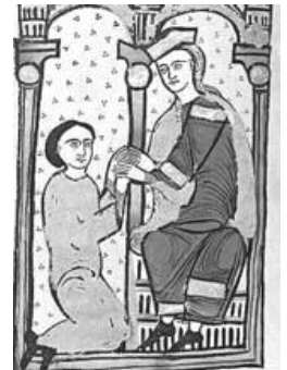
Agenouillé, le vassal place ses mains dans celles de son suzerain.

Le vassal jure fidélité à son suzerain . Il reçoit alors un fief (en général des terres). Si ce fief est vaste, il pourra alors prendre un seigneur moins puissant comme vassal et lui donner une partie de son domaine. Etc